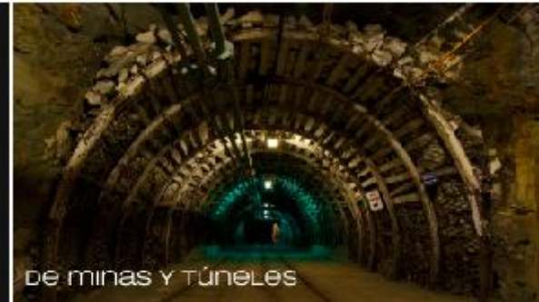
de minas y túneles